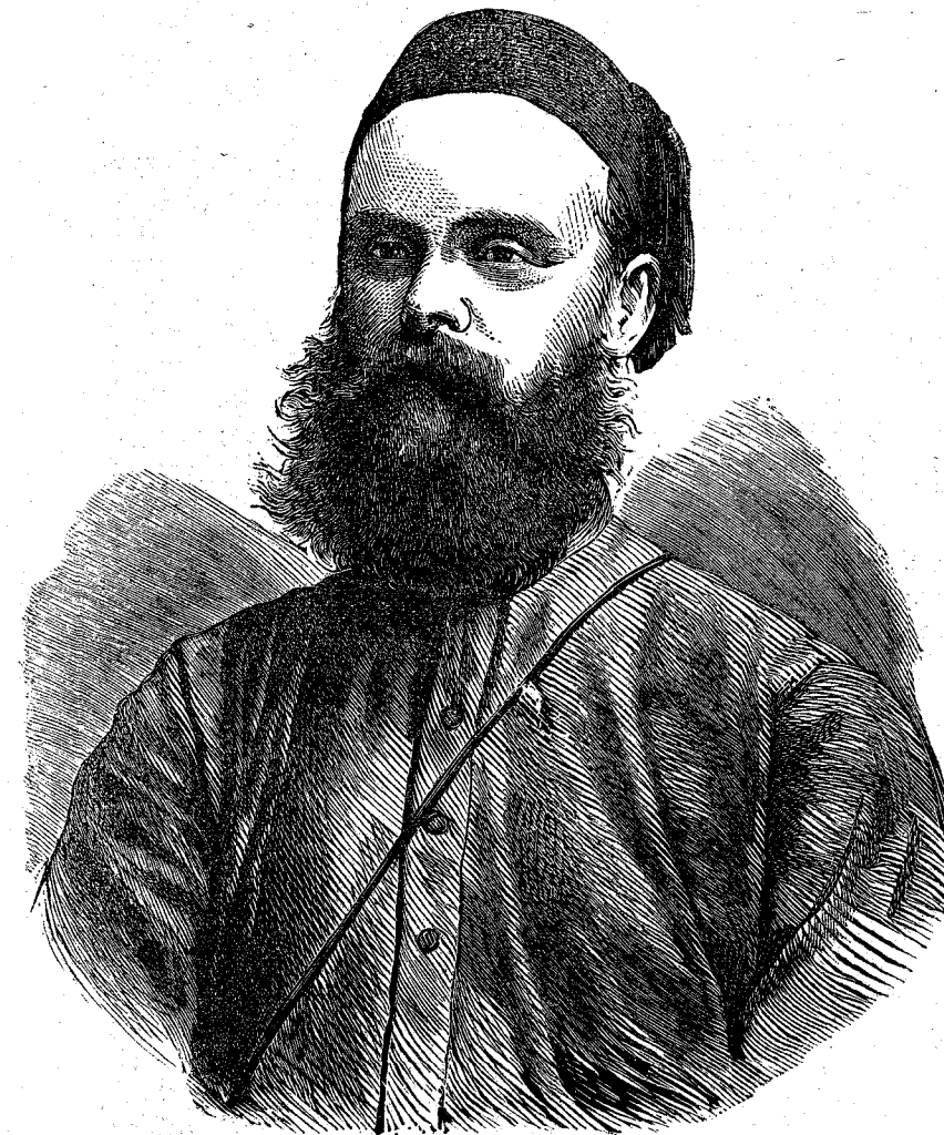
Ὁ Βαρῶνος VON DEN DECKEN.

ΤΙΧΟΝΤΕΣ πρό τινος χρόνου ἐν τῇ διευθύνσει τῆς.